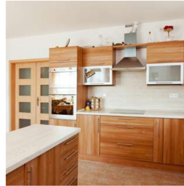
VEXTA 130 | Litkovice