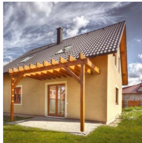
VEXTA 130 G | Šestajovice

První domy jsme postavili již v roce 1992, od roku 2000 jsme je stavěli pod značkou Vekra stavební. Po konsolidaci všech našich divizí, která proběhla v roce 2012, nás znáte jako VEXTA DOMY.