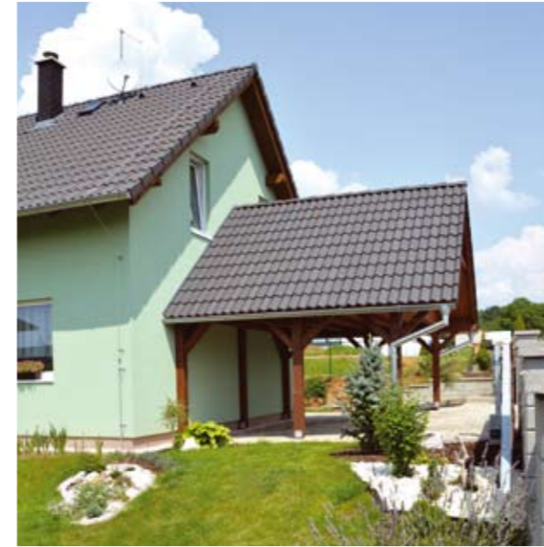
VEXTA 130 | Kněžmost