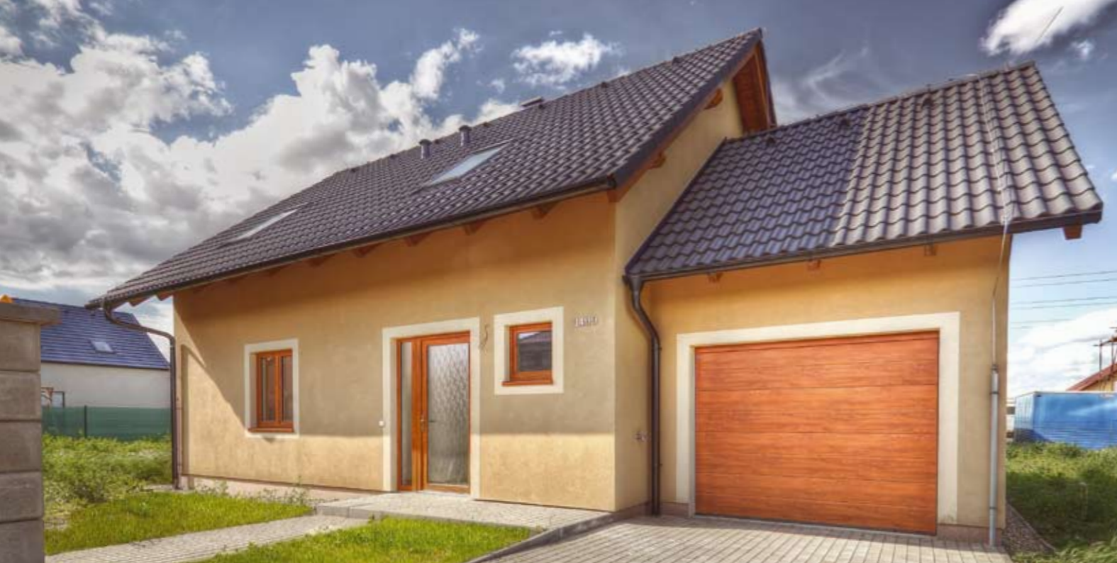
VEXTA 149 TREND G | Pyšely