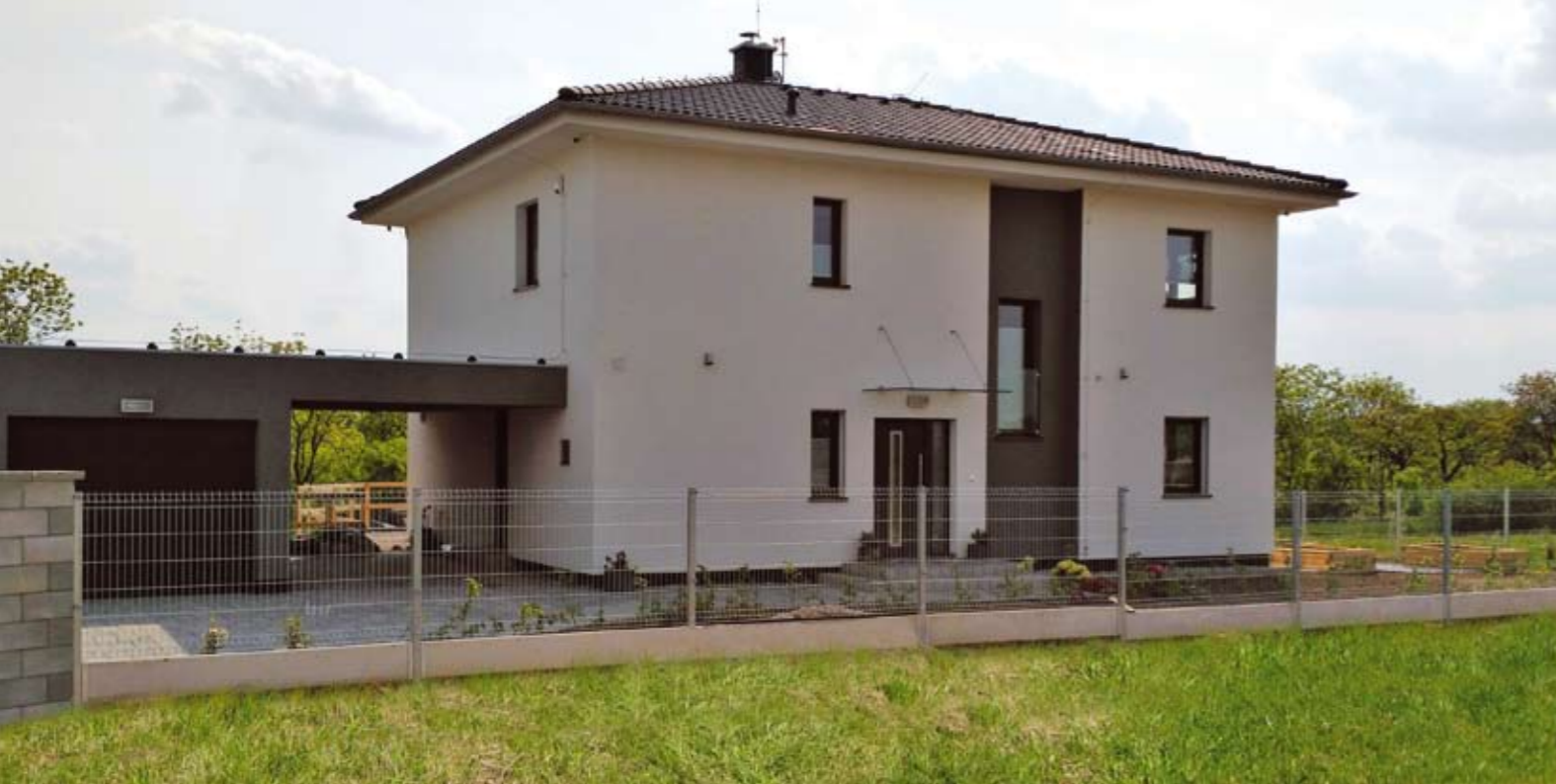
VEXTA ATYP | Tuchoměřice

Pro typové domy – projektová dokumentace zdarma, transparentně viditelná cena základové desky atd. Projekci zahajujeme až po podpisu smlouvy o dílo, projekt tak obsahuje skutečné realizační řešení.