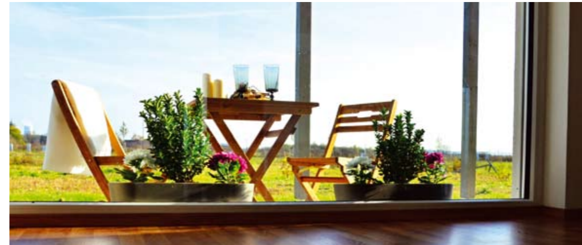
VEXTA 104 TREND | Obrříví