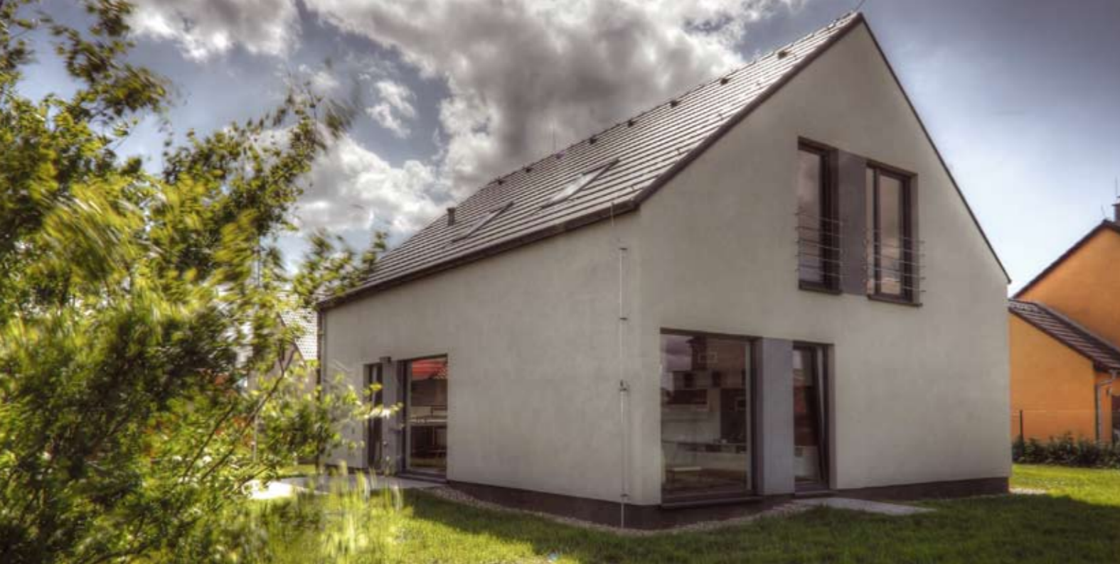
VEXTA 149 TREND G | Šestajovice