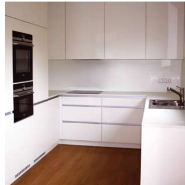
VEXTA 146 TREND | Předboj

Pro přehlednost jsme podlahové plochy každého domu zpracovali do jeho názvu. Ptejte se na to samé i u konkurence. Je porovnáváný dům opravdu stejně velký?