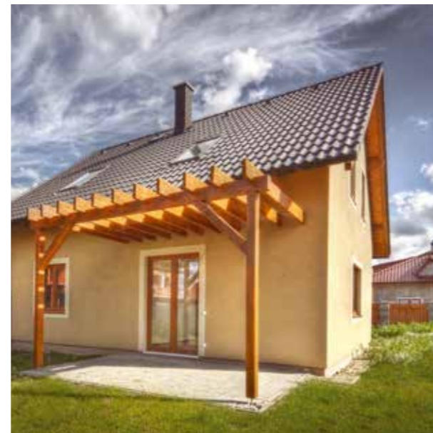
VEXTA 130 G | Šestajovice

První domy jsme postavili již v roce 1992, od roku 2000 jsme je stavěli pod značkou Vekra stavební. Po konsolidaci všech našich divizí, která proběhla v roce 2012, nás znáte jako VEXTA DOMY.