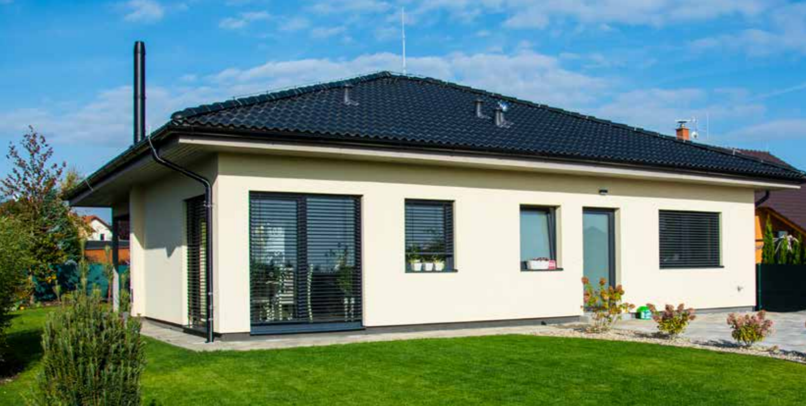
VEXTA B92 | Šestajovice