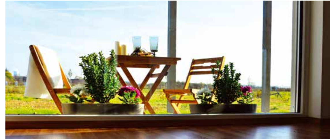
VEXTA 104 TREND | Obrázků