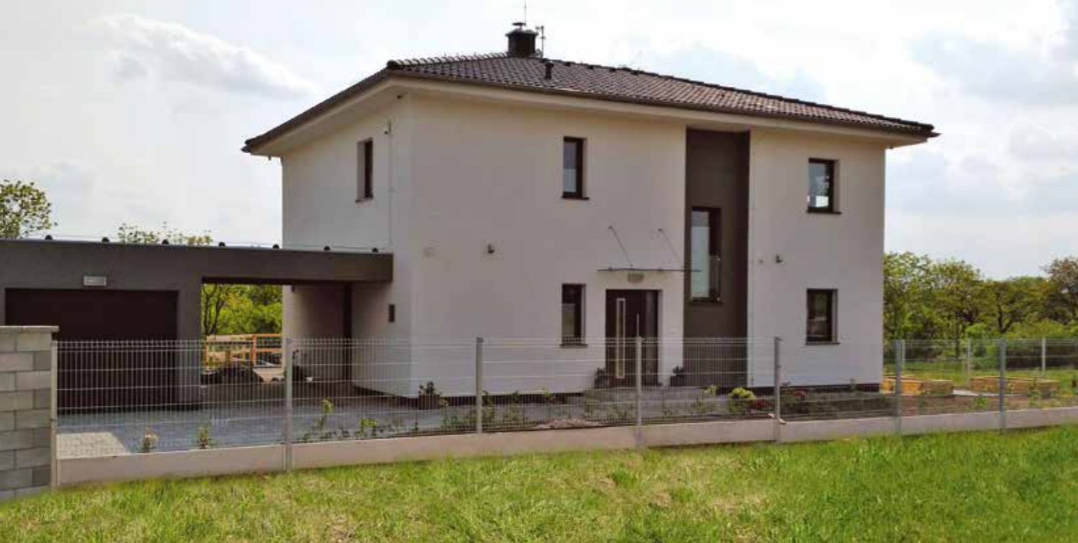
VEXTA ATYP | Tuchoměřice

Pro typové domy – projektová dokumentace zdarma, transparentně viditelná cena základové desky atd. Projekci zahajujeme až po podpisu smlouvy o dílo, projekt tak obsahuje skutečné realizační řešení.