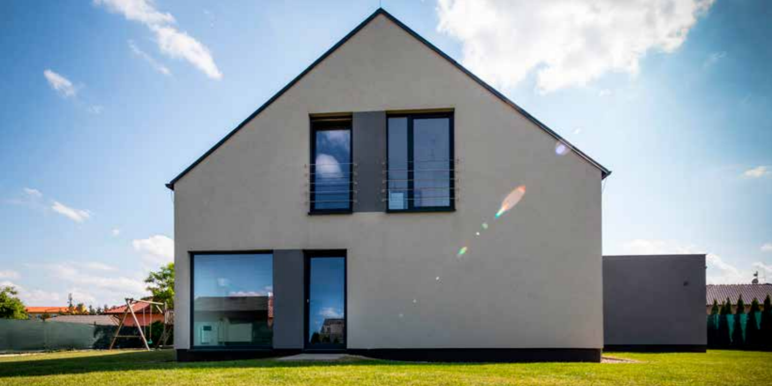
VEXTA 149 TREND G | Šestajovice