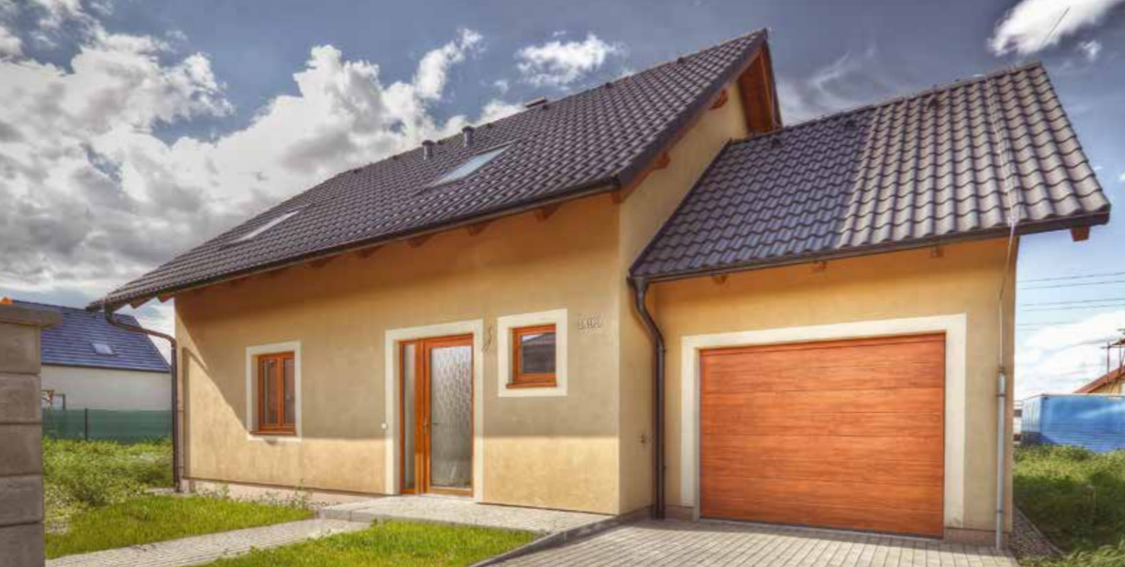
VEXTA 149 TREND G | Pyšely