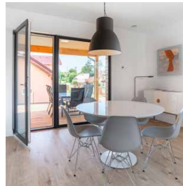
VEXTA B106 | Tršice u Olomouce

V Šestajovicích u Prahy provozujeme od roku 2012 dům VEXTA 149 TREND s garáží, který patří mezi nejprodávanější. V Tršicích u Olomouce je od jara roku 2019 otevřen vzorový bungalov VEXTA B106.