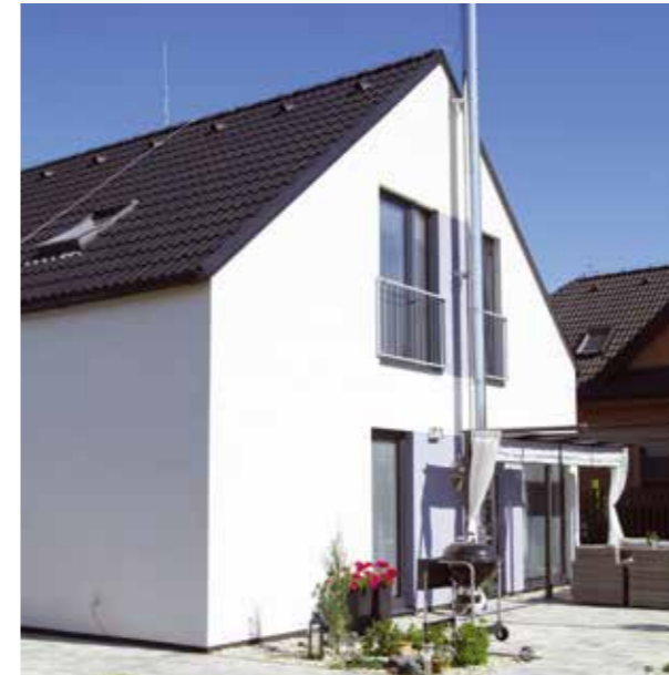
VEXTA 149 TREND G | Šestajovice